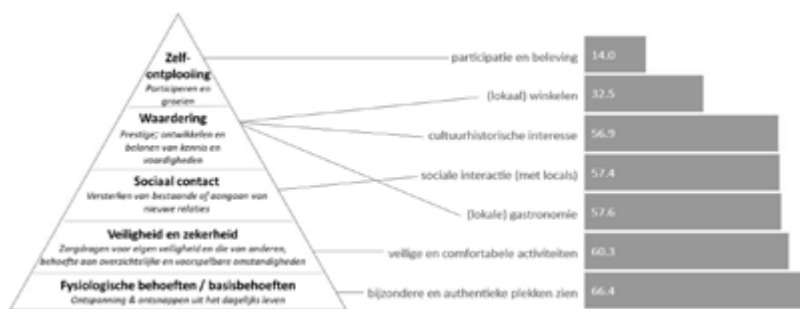
Figuur 1: De behoeftenpiramide van Maslow toegepast op toerisme en vergeleken met de gedragscomponenten van toeristen in Ljubljana.

Naast haar attracties, omgeving en sfeer heeft de stad ook veel bekendheid gekregen dankzij nominaties voor verschillende titels en labels. Zo is de stad in 2016 uitgeroepen tot European Green Capital. Ook heeft Ljubljana een gouden label gekregen binnen de 'Green Scheme of Slovenian Tourism', een beoordelingssysteem dat op nationaal niveau de toeristensector naar een milieuvriendelijker niveau moet brengen. Tegenwoordig kent Ljubljana 542 m2 aan openbare groene ruimte per inwoner, met veel mogelijkheden voor milieuvriendelijke toeristische activiteiten. Daarnaast voldoet de stad aan hoge milieustandaarden. In 2019 werd Ljubljana erkend met de Europese Smart Tourism Award voor uitstekende