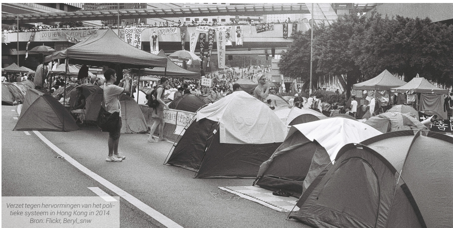
Verzet tegen hervormingen van het politieke systeem in Hong Kong in 2014.

Maar, zoals hierboven beschreven, lijkt de scope voor grootschalig verzet in de 21e eeuw vernauwd. Dit betekent echter niet dat verzet – tegen de markt, ongelijkheid en onrecht – verdwenen is. In plaats daarvan heeft verzet veelal andere vormen aangenomen. Over de hele wereld zien we dat kleinschalige grassroots bewegingen wel duidelijk aanwezig zijn, en in staat zijn verzet teweeg te brengen. In veel gevallen richten deze vormen van verzet nog steeds op het bieden van tegenwicht aan neoliberalisering, en bevragen zij structurele ongelijkheden. Maar deze vormen van verzet ontstaan niet alleen uit sociaaleconomische tegenstellingen, maar borrelen juist op langs andere, groeiende breuklijnen in de samenleving. Het gaat hier om gemarginaliseerde groepen die niet of nauwelijks gehoord worden, en via verzet hun plek claimen en hun belangen op de kaart zetten. En dit zijn diverse groepen, van wie je niet direct zou verwachten dat ze zich mobiliseren om in verzet te komen. Deze groepen richten hun verzet doorgaans op onderwerpen op een relatief laag schaalniveau die hen direct raakt. Het gaat dan om concrete en behapbare thema's, zoals vaak het geval is bij sociale bewegingen. Maar deze thema's zijn wel ingebed in bredere en globalere kwesties met betrekking tot structurele ongelijkheden en misstanden. Veel grassroots bewegingen slagen er niet in om hun verzet naar een hoger schaalniveau te brengen en blijven sterk gefocust op het nabije en concrete, andere bewegingen