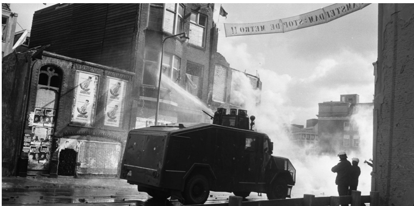
Rellen in de Nieuwmarktbuurt, 1975.

Terhorst, P. en Van de Ven, J. (2003) The Economic Restructuring of the Historic City Center. In: S. Musterd en W. Salet (red.), Amsterdam Human Capital . Amsterdam: Amsterdam University Press