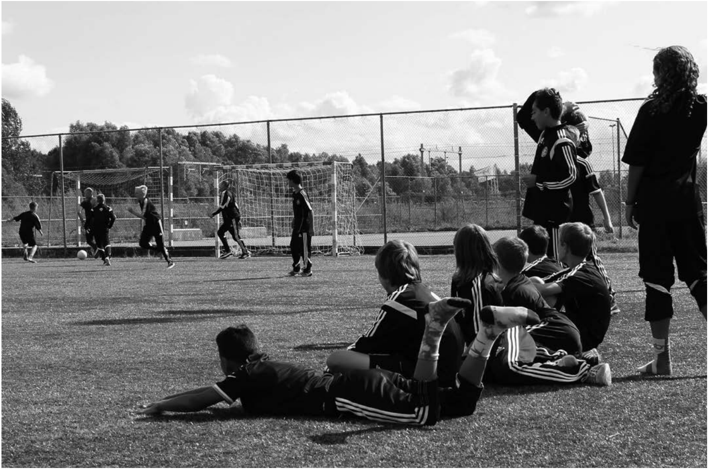
Verbinding en ontmoeting door voetbal. Internationaal voetbalteam op uitwisseling in Utrecht.

sportaanbod, roepen vraagtekens op over de betekenis van sport als verbindende factor tussen mensen. Toch lijkt deze verschuiving nog niet echt een gevaar te vormen voor het sportverenigingsleven en het sociaal kapitaal dat sporters hier opdoen. Nog steeds telt Nederland vergeleken met andere Europese landen een bovengemiddeld aantal lidmaatschappen en sportverenigingen per hoofd van de bevolking.