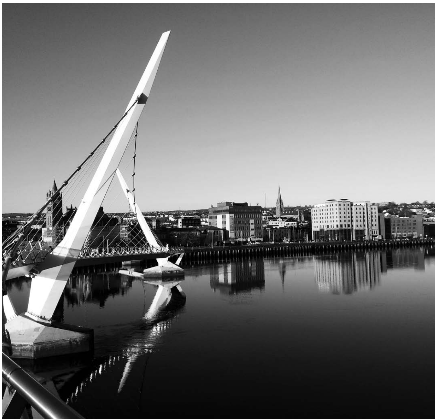
Derry/Londonderry: het versterken van het stedelijke imago.

Ook de sociale en culturele rendementen, die in veel gevallen nog zwaarder worden gewogen, waren grotendeels positief. 66% van de Liverpoolians gaf aan deel te hebben genomen aan ten minste één ECOC evenement, en 85% vond dat Liverpool er als stad op vooruit was gegaan. Volgens 99% van de bezoekers was de sfeer aangenaam en 97% voelde zich welkom in de stad. En natuurlijk is de media-aandacht voor de stad enorm gegroeid in 2008. Het aantal positieve verhalen in de pers groeide tussen 2007 en 2008 met liefst 71%. Een aantal grootschalige nieuwbouwprojecten, zoals Liverpool One, hebben ook bijgedragen aan het verwezenlijken van de stedelijke vernieuwingsdoelen.