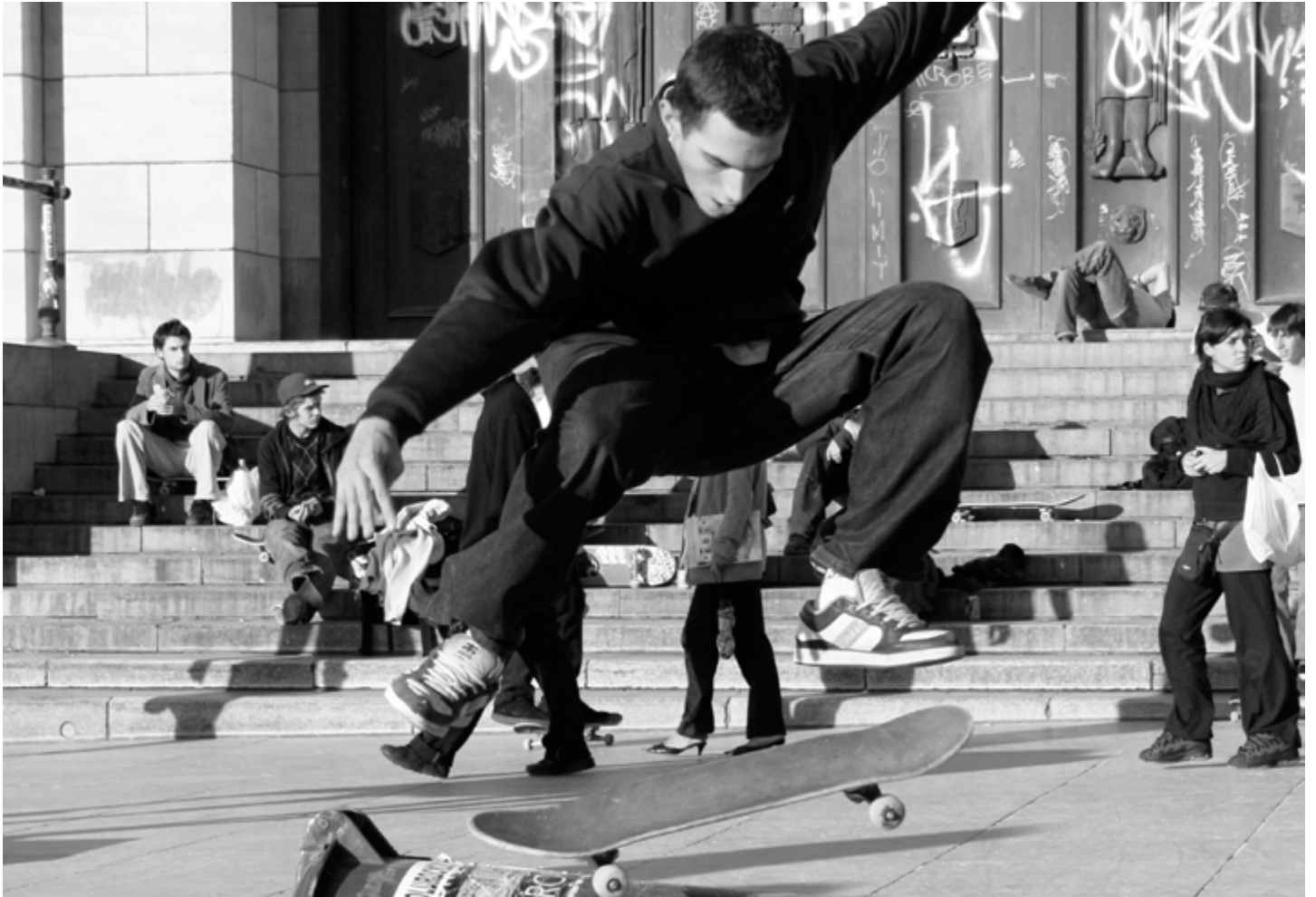
Voorkant AGORA 2006, mobiliteit.

Vast staat dat diverse landen de ambitie hebben om emissies terug te dringen. De reductiedoelstellingen van een aantal westerse landen liegen er niet om: Nederland wil 40 procent minder CO 2 -uitstoot in 2030 (ten opzichte van het niveau van 1990), het Verenigd Koninkrijk wil in 2050 een reductie van 80 procent bereikt hebben. Om deze doelstellingen te behalen is het essentieel transportgerelateerde CO 2 -uitstoot te verminderen. Daartoe moet er meer veranderen dan incrementele verbeteringen in de autotechniek. Als dit niet gebeurt, en we doorgaan op de huidige voet, zou volgens schattingen van de OECD het totaal aan transportgerelateerde CO 2 -emissies tussen nu en 2050 zomaar kunnen verdubbelen.