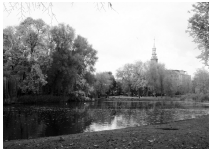
Het Oosterpark in Amsterdam.

Een voorstel om het Oosterpark 's nachts af te sluiten om de overlast van alcoholisten in het park tegen te gaan stuitte namelijk op protest van een andere groep: mannelijke cruisers die de bossages 's nachts