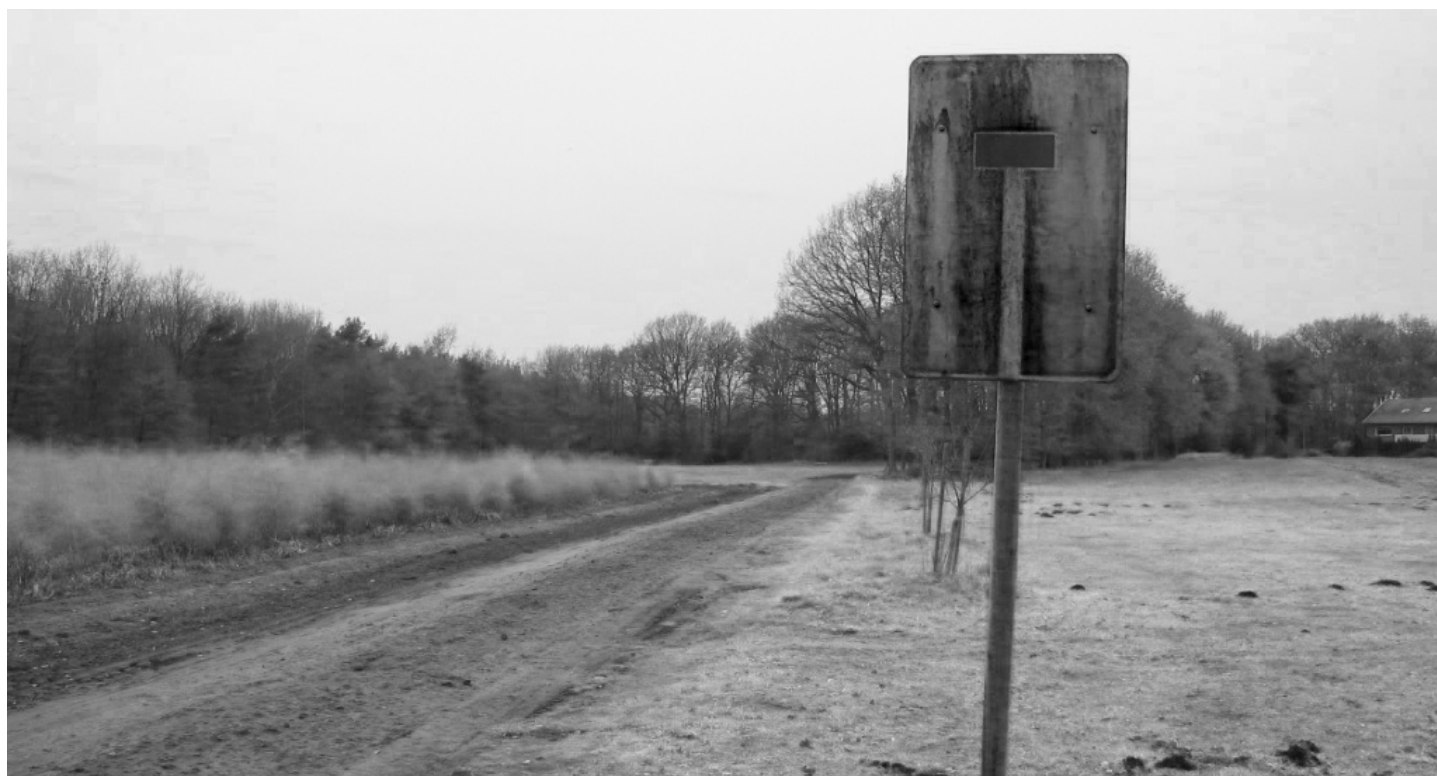
Dit bord is een voorbeeld van een grens. Voor de voorbijganger bevindt zich hierachter een verborgen landschap.