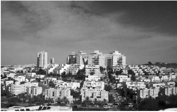
Israëlische koloniale nederzetting Modi'in: het model voor Palestijnse vastgoedontwikkeling 'met een hoofdletter M'.

de wil van Israël, die dergelijke projecten eerst steun en goedkeuring moet geven. Er is expliciet vastgelegd dat "de Israëlische regering met de Palestijnse Autoriteit de specifieke voorgestelde huisvestingsprojecten zal bediscussiëren." De Palestijnse politieke en economische elites hebben niettemin hun enthousiasme betoond en zijn sterk betrokken geraakt bij deze ondernemingen.