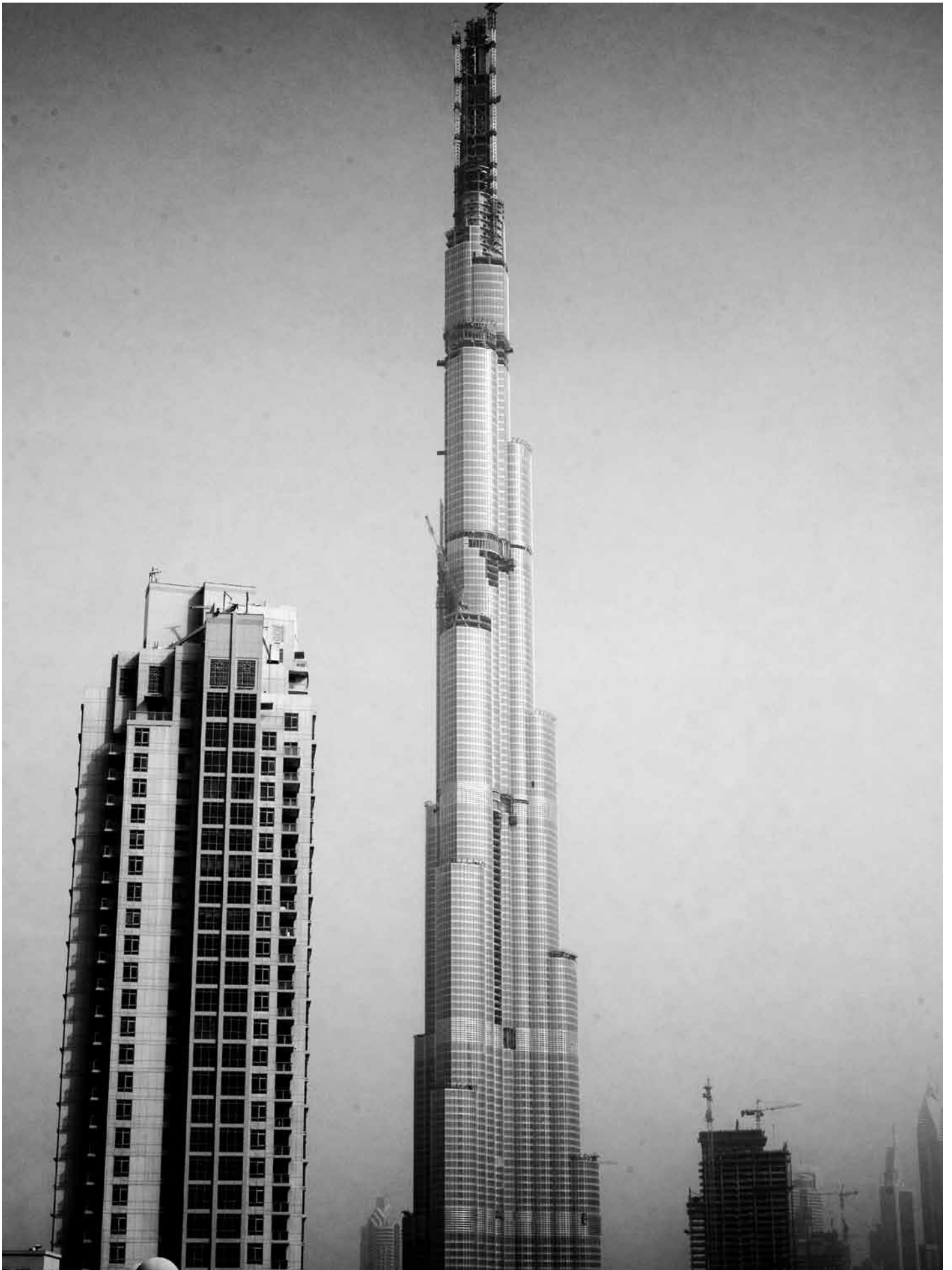
De Burj Dubai belichaamt Dubai's verreikende mondiale ambities.