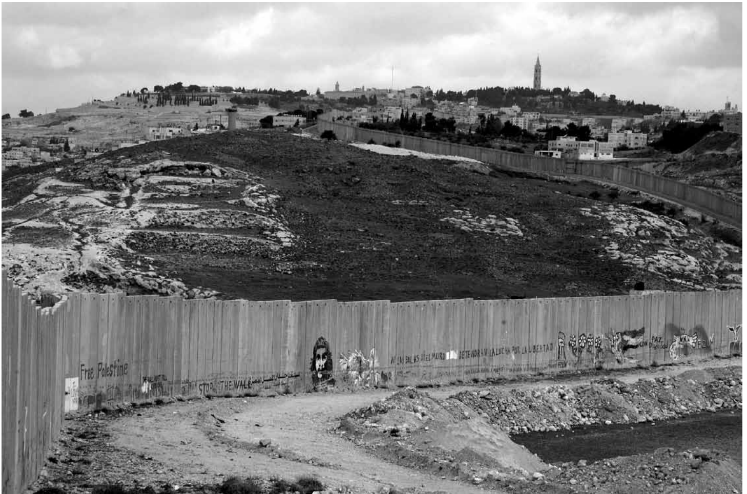
De Israëlische Westoeverbarrière fragmenteert de Palestijnse geografie.

controle over zo'n tachtig procent van de Westelijke Jordaanoever, Gaza en Oost-Jeruzalem, en is ze nu - juist door het Oslo-proces - als 'legale bezetter' niet meer verantwoordelijk voor het verstrekken van basisvoorzieningen als water, gezondheidsvoorzieningen en huisvesting. Het onderhandelingsproces zette een geografisch onteigeningsproces in gang dat de Palestijnse geografie fragmenteert. De hele matrix van controle door middel van koloniale nederzettingen, corridors, massieve barrières, controleposten en militaire bases draagt hier verder toe bij. Uiteindelijk heeft dit geleid tot een amalgaam van gedisconnecteerde apartheid in de vorm van enclaves.