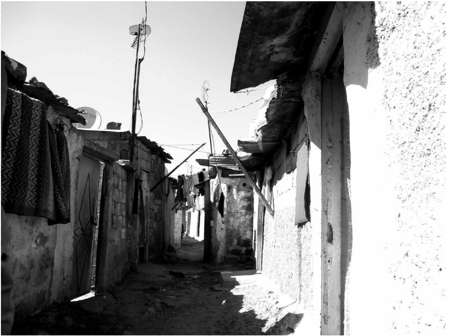
Bidonville Sidi Moumen (Casablanca). Hier kan geen voertuig passeren.

stedelijke expansie informeel. In de woelige jaren zeventig moest Marokko afrekenen met een diepe financiële crisis. De overheid kon de vraag naar goedkope woningen niet bolwerken en om politieke stabiliteit en rust in het land te bewaren, zag ze zich verplicht om zich nog toleranter op te stellen tegenover de informele stedelijke uitbreidingen. Deze resulteerden niet enkel in sloppenwijken, maar ook in meer duurzame vormen van stadsuitbreiding. Er werden geheel nieuwe wijken gebouwd die het evenbeeld zijn van de formeel gereguleerde wijken. Ze werden opgetrokken uit baksteen door professionele bouwbedrijven. Het enige verschil is dat dit plaatsvond zonder officiële vergunningen, met als gevolg dat in deze wijken een groot aantal basisvoorzieningen, zoals water, elektriciteit, riolering en asfaltwegen, ontbrak.