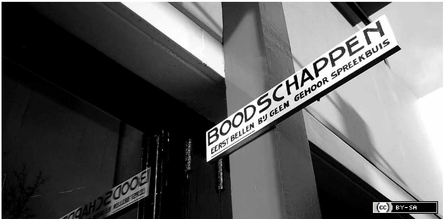
Detail van het Rietveld Schröderhuis in Utrecht.

nemen om boven het niveau van de individuele steden uit te stijgen. Er kan een programma worden ontwikkeld waarin de aspirant-Culturele Hoofdsteden van elkaar leren hoe de culturele en bredere stedelijke ontwikkeling elkaar kunnen stimuleren. Onderdeel van zo'n aanpak is dat het Rijk, en dus niet alleen het ministerie van OCW, helder voor ogen krijgt hoe de steden zich kunnen voorbereiden op 2018 en welke randvoorwaarden en investeringen daar ten aanzien van bijvoorbeeld verkeer, vervoer en economie voor nodig zijn. Je hoeft in zo'n programma niet bij nul te beginnen. Er kan immers voortgebouwd worden op de samenwerking die er al is, zoals het eerder genoemde initiatief AR'dam.