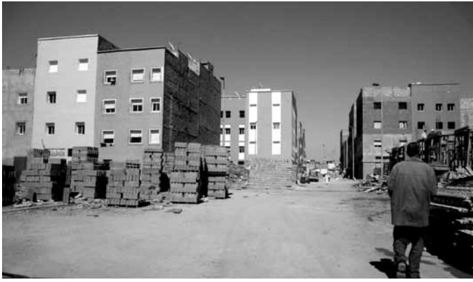
De nieuwe woonblokken zijn gescheiden door brede wegen, zodat ze beter toegankelijk zijn.