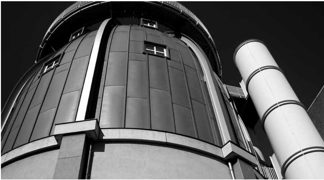
Het Bonnefantenmuseum, Maastricht.

van Europa als de realisatie hiervan in nauwe samenwerking met deze omringende Euregio Maas-Rijn vorm te geven. Deze regio omvat een gebied met circa 3,7 miljoen inwoners, gevormd door de Nederlandse provincie Limburg, de Duitse regio Aken en de in België gelegen Vlaamstalige provincie Limburg, de Franstalige provincie Luik en de Duitstalige gemeenschap Eupen. Het hart van de regio wordt gevormd door het stedelijk landschap van de steden Maastricht, Aken, Hasselt, Heerlen, Luik en Sittard-Geleen.