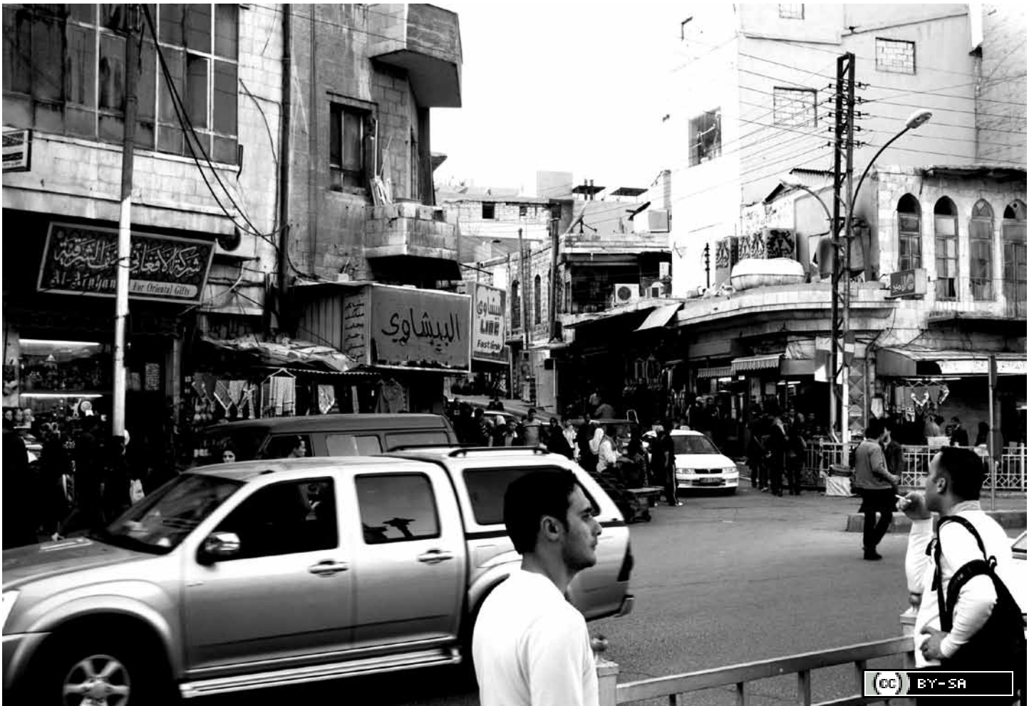
Het centrum van Amman, Jordanië.