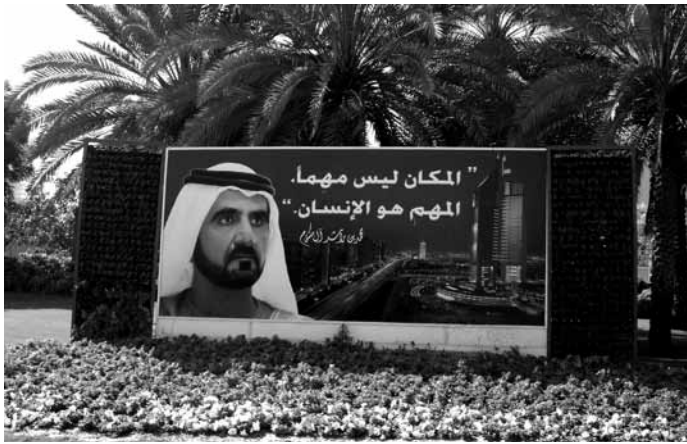
Sheikh Mohammad bin Rashid Al Maktoum: "We wachten niet op de toekomst, we maken die zélf." (Dubai)

van oorlog, olie(geld) en religieus fundamentalisme aan de orde van de dag is, terwijl talloze andere processen niet werden gerapporteerd. Sinds 9/11 en de daaropvolgende door de Verenigde Staten aangevoerde oorlogen in het Midden-Oosten is dit spectrum allesbehalve genuanceerd.