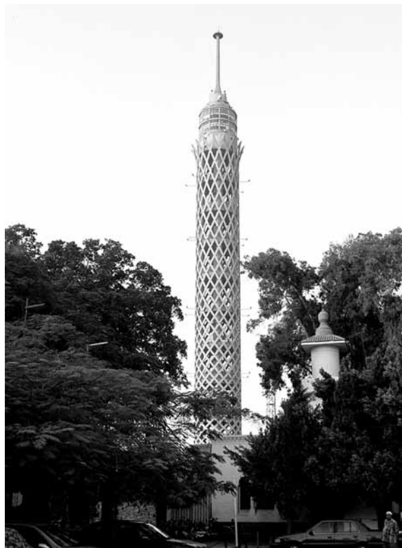
De Cairo Tower, een stille getuige van het Nasserisme.

Tijdens de Ayyubidendynastie (1174-1250) werd Caïro een van de