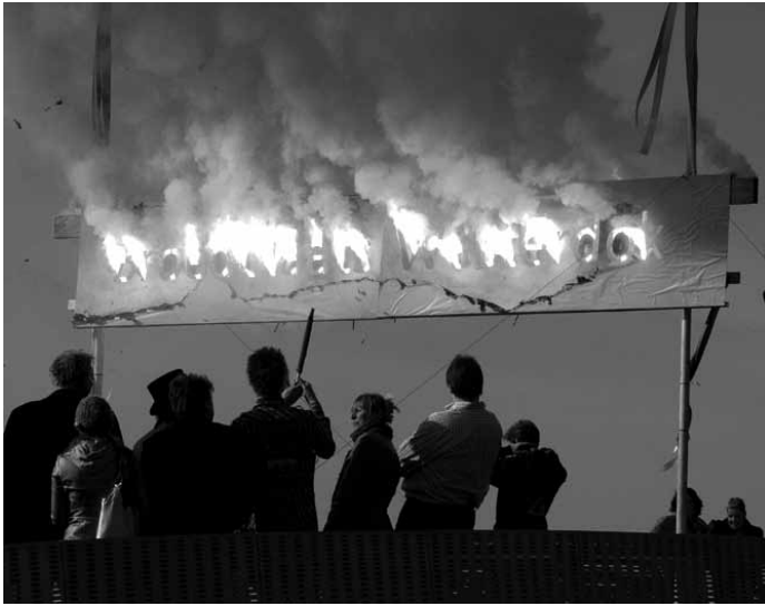
De opening van Westerdok (maart 2009), de eerste nieuwbouwbreedplaats in Amsterdam.

mede op basis van het aanwezige culturele klimaat.